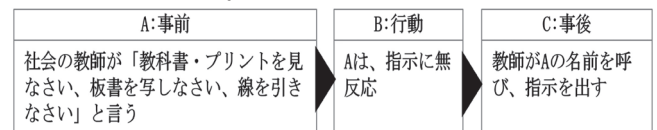
Fig.1 授業中の問題の三項随伴性

期以降は発生していなかった。授業観察を「教科書を開く、板書を写す等の教師の指示に10秒以内に正反応」を標的行動として実施した結果、正反応率75%以下が2回あった。正反応率(%)は、Aの正反応の回数を教師の指示の回数で割り、100を掛けることによって算出した。この問題の三項随伴性をFig.1に示す。支援では、TがAに授業で使う語彙・背景知識とその教科を学ぶ意味を説明し、指示に対応した正反応をシェイピングした。